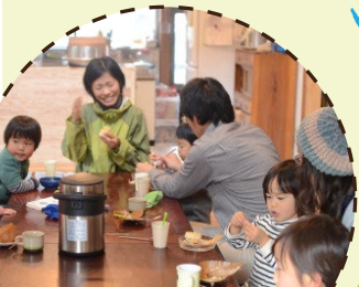
里山に暮らす人々と交流♪