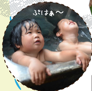
源泉かけ流し温泉