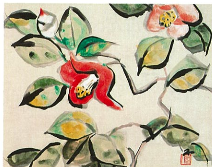
木村荘八《椿図》1930-40年代