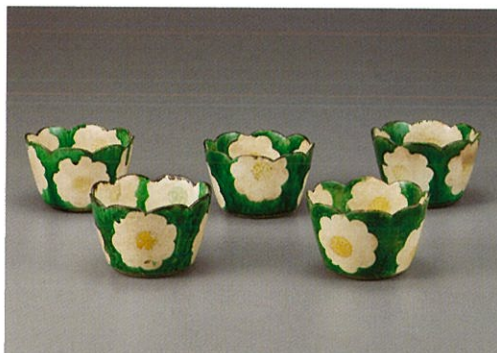
尾形乾山《色絵椿文輪花向付》18世紀