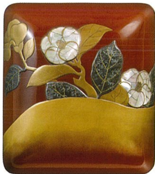
尾形光琳《椿図蒔絵硯箱》18世紀

本展は優れた椿絵の収集で知られる「あいおいニッセイ同和損保コレクション」の中から、江戸時代の琳派を代表する尾形光琳、乾山や岸田劉生、熊谷守一、小倉遊亀、堀文子など現代の巨匠に至るまでの作品約70点を紹介します。ヤブツバキの名所として知られる打吹公園・椿の平の花とあわせてご覧ください。