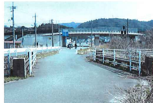
手前が旧。跨線橋が新「上井橋」

ました。国道179号の、JR山陰本線をまたぐ「跨線橋」の名前も、『上井橋』と命名されているのです。