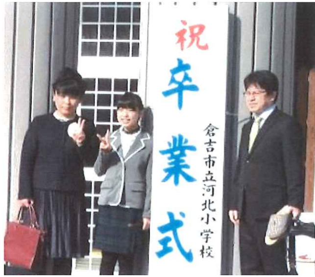
河北小学校の玄関前で記念

河北小学校の卒業式は、3月17日(金)。河北中学校の卒業式は、3月14日(火)に行われました。