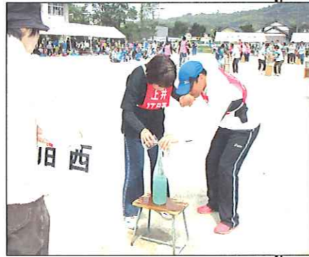
熱戦! 昨年の運動会風景

とき 5月14日(日) 午前9時30分開会 ところ 河北小学校グラウンド (雨天の場合) 5月21日(日)