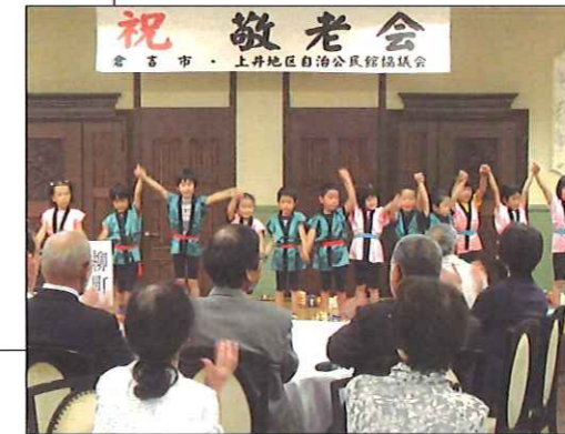
園児の演技に拍手