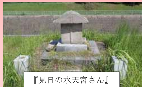
『見日の水天宮さん』