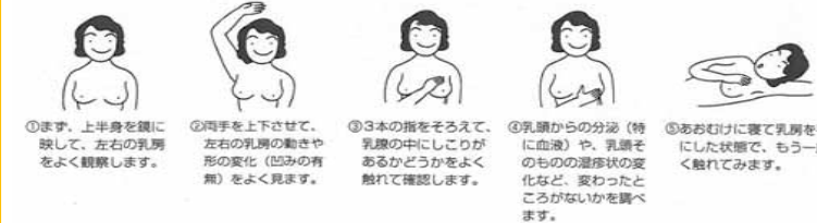
乳がんのセルフチェック-自己検診のしかた

乳がん患者は年々増加傾向にあり、日本人女性の12人に1人が乳がんになるといわれています。しかし、乳がんは早期発見・治療により他のがん比べて治る可能性が高く、自分で発見できる数少ないがんのひとつです。検診がない間のセルフチェックが早期発見には非常に重要です。検診に加えて、月1回のセルフチェックを習慣にしましょう。また異常がみられた際は、速やかに乳房疾患を専門とする医療機関を受診しましょう。