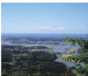
拝殿裏の展望台から望む美しい日本海