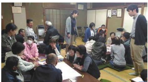
各班に分かれて支え愛マップ作成

されるという行動、そこには「大谷」というまちと、近所との繋がり、そこに暮らしている自分自身の生活への愛着があるのだなと想像します。