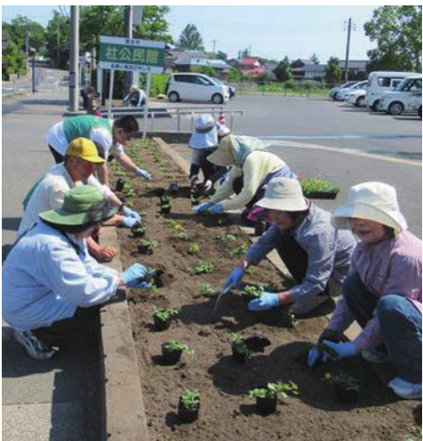
ボランティアの皆さんによる花植作業

6月19日(月)、 梅雨を感じない初 夏に、公民館の花壇の花植えを20 名近くのボランティアさんとダイ ナム鳥取倉吉店の方も参加いた だき実施しました。 花壇や公民館周りの草とりから 始まり、秋まで咲き続けてくれる ポーチユラカを1ポットつつ植え ていきました。これから花も根付 いていき、綺麗な花がいっぱいに なっていくのが楽しみです。