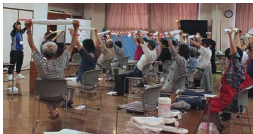
鳥取看護大学生に「体ほかばか体操」の指導を受ける参加者

教室」は毎月開催していきます。また、館報に日程は記載してありますので、地域の皆さんの参加をお待ちしています。