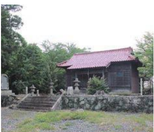
現在の四王寺拝殿

「子供たちが健やかに育ち、誰もが楽しく・安心して・自分らしく元気に暮らせる大谷」を目指す大谷にとって、四王寺山の整備や四王寺祭の開催など伝統の維持継承も、高齢化社会における一つの課題であると同時に、まち全体の結束や絆づくりに欠かせないものです。今年も例年通り海の日(7月17日)に開催される四王寺夏祭りは、四王寺の建立から1150年という節目であることから、四王寺に関わる歴史を改めて知るためのオリエンテーリングなども