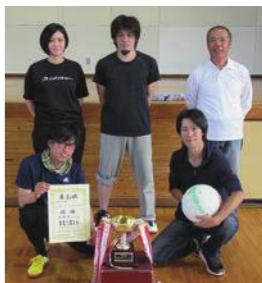
優勝した大谷Bチーム