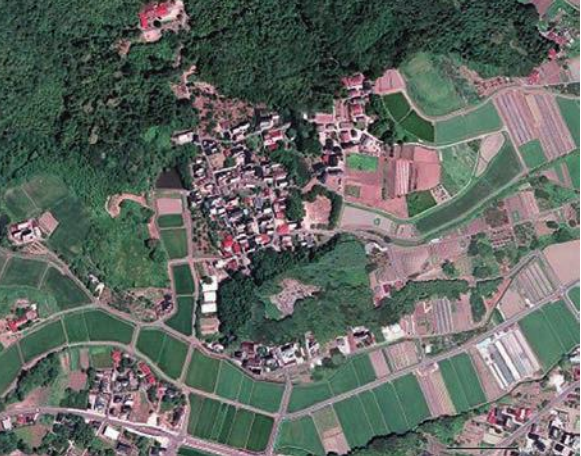
上空から見た大谷集落

1150年の間、途絶えることなく四王寺を守ってきた大谷は、様々な活動を通じて、これからも絆や支え愛の優しさを守り育てていけることでしょう。