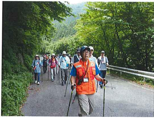
▲ 初夏の新緑の中を歩く。

歩き始めは、キツイ登り坂。すぐに湖を渡る橋へ。風も気持ちよく屏風岩を望む景色も最高！約4kmのコースを歩きました。「普通に歩くより楽だな。ポールを買って始めたい」「景色や空気が良いので楽しい」と多くの感想が。お腹も空き、美味しいご飯をいただきました。熱中症や天気が心配でしたが、親睦も深まり健康バッチリ！でした。