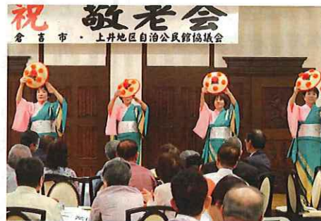
会場を盛り上げた「民謡鈴の音会」のみなさんの踊り

式典の後は、芸能鑑賞。3人の女性グループ「トライアングルはな」のオカリナ演奏では、歌詞を口ずさむ声 flowed. 「民謡鈴の音会」の踊りには盛大な拍手が送られ、終始和やかな会になりました。(戸田)