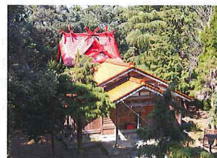
本殿の屋根、鮮やかな朱色の