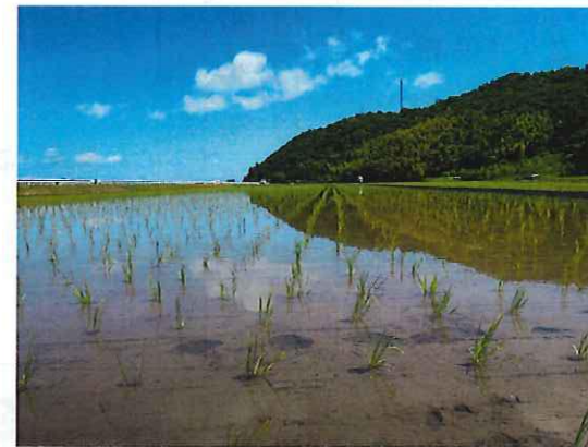
田植えが、“終わったでえ”