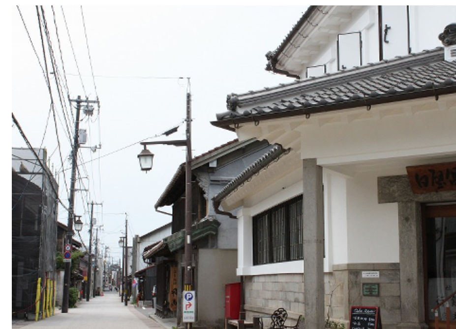
む望を通 魚町前店支行銀三第吉倉