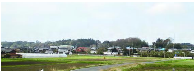
その昔、横田銀座と呼ばれた町の全景

自治公加入戸数105戸 総人口344名世帯数121世帯(29年3月末現在) 昨年未、新しい公民館が完成落成したばかり。 登録有形文化財の矢城家住宅や横田神社など歴史ある建造物も多い。 地区での敬老会やお花見会のほか、運動会、グラウンドゴルフ大会などもまちでの行事として変わらず行われている。