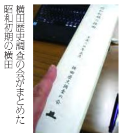
横田歴史調査の会がまとめた昭和初期の横田

さんや「散宿所」と言われる電灯会社の出張所もあり、高城・北谷から倉吉の町に歩いて往復するのが容易でなかった時代には横田が中間地点だったことから商店や製造業も次第に増え、昭和40年頃マイカー時代が到来するまでは、日常生活のほとんどが横田で完結するような村が形成されていたとのこと。