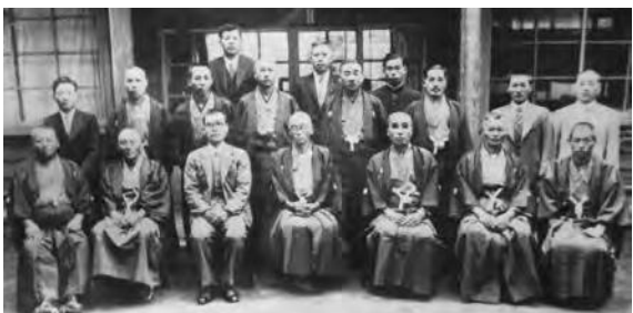
矢城家で保存されている社村役場の写真

形のあるものは維持管理し保存していくのに、時間もお金も労力もかかります。それは大変な負担になることもありすが、絆やつながり・感謝・