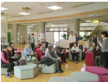
しあわせの郷でお花見会