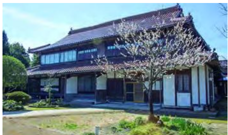
登録有形文化財となった矢城家住宅