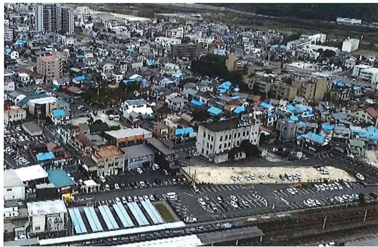
▲ 2016年秋。多くの建物にブルーシート…。