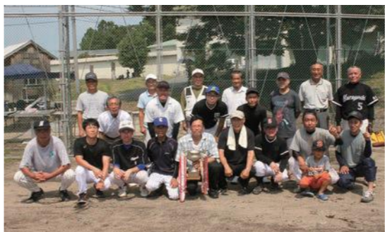
「市民大会予選の部」で優勝した国府チーム

8月20日(日)に社地区ソフトボール大会が行われました。場所は、往年の方には懐かしい、30数年ぶりの農高グランドです。試合は、気温30度を超える暑さに負けない熱戦が繰り広げられました。「市民大会の部」では、国府が昨年の雪辱を果たし優勝。「親睦の部」では、秋喜新町Aが猛打と堅い守りで