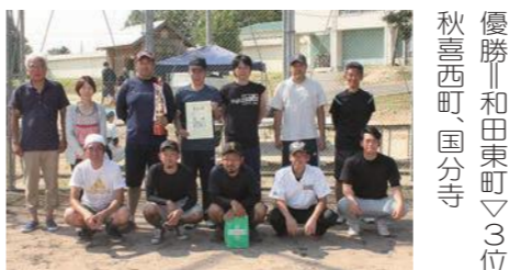
「親睦の部」で優勝した秋喜新町Aチーム

勝ち進み、今年準備された真新しいトロフィーを受け取りました。国府は、10月9日(月)の市民体育大会に出場されます。活躍を祈念します。(体育副部長 大羽省吾) 【市民大会予選の部】