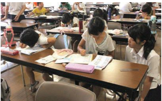
ボランティアを「先生」に宿題に取り組む児童