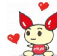
血液キャラクター「けんけつちゃん」

今年成人式を迎える「はたち」のみなさん、おめでとうございます。みなさんは献血をされたことがありますか？国内の医療に必要な血液製剤を確保し、安全性を高めるために「400ml 全血献血」及び「成分献血」が求められています。「はたち」になったみなさんの「元気」を献血に役立ててみませんか？ご協力おねがいします。