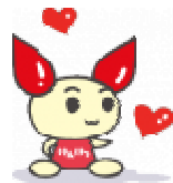
血液キャラクター「けんけつちゃん」