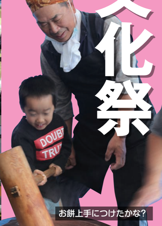
お餅上手につけたかな?