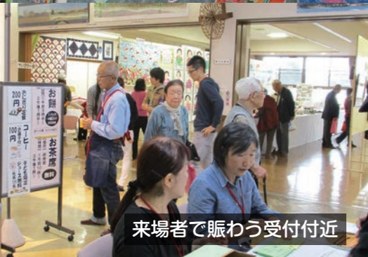
来場者で賑わう受付付近

社文化祭 ★ガラス細工体験 ★喫茶コーナー ★お茶席コーナー ★読み聞かせコーナー ★紙芝居劇場 ★社小PTA《販売》 ★大谷茶屋《販売》