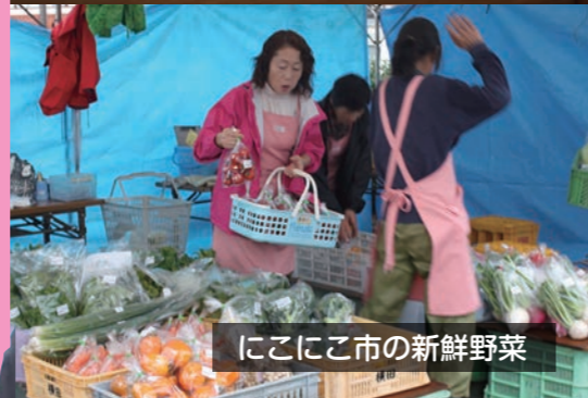
にこにこ市の新鮮野菜