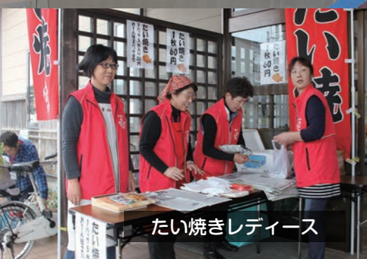
たい焼きレディース