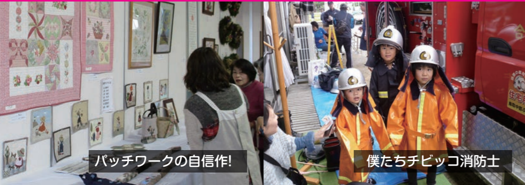
パッチワークの自信作!

今年一年お疲れ様でした。来年も力を合わせ、楽しいやしろにしていきたいと思います！