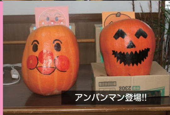
アンパンマン登場!!