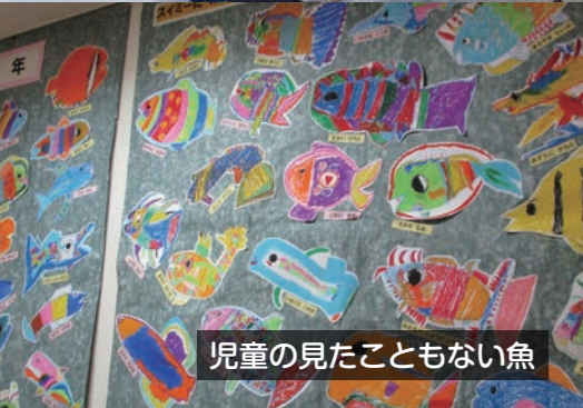
児童の見たこともない魚

社文化祭 ★ガラス細工体験 ★喫茶コーナー ★お茶席コーナー ★読み聞かせコーナー ★紙芝居劇場 ★社小PTA《販売》 ★大谷茶屋《販売》