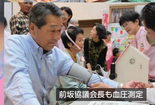
前坂協議会長も血圧測定