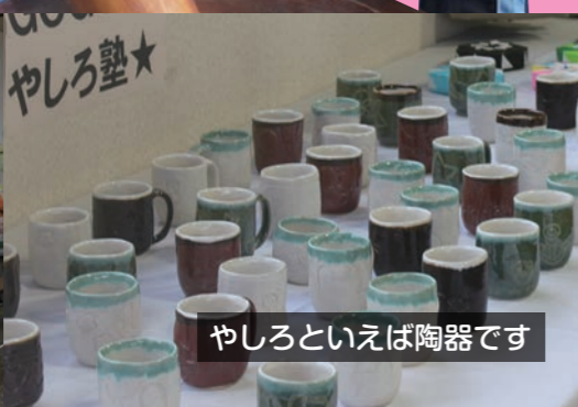
やしろといえば陶器です