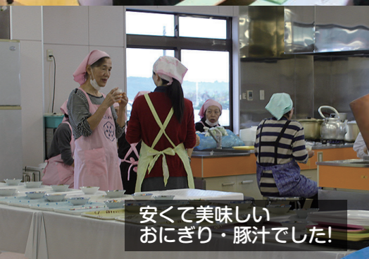
安くて美味しい おにぎり・豚汁でした!