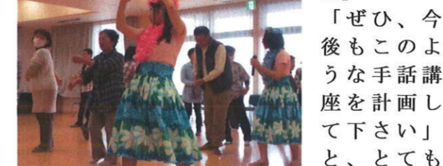
高校生の手ほどき。手話しながら、貝殻節をフラダンス