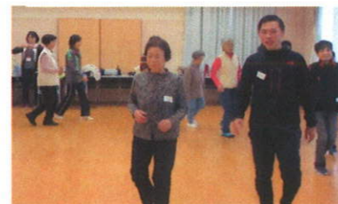
「ここにこペース」で歩く

スロージョギングは、歩く速度で走るジョギング。歩幅は小さく、「ここにこペース」を守り、着地は足の前部分から。1日合計30