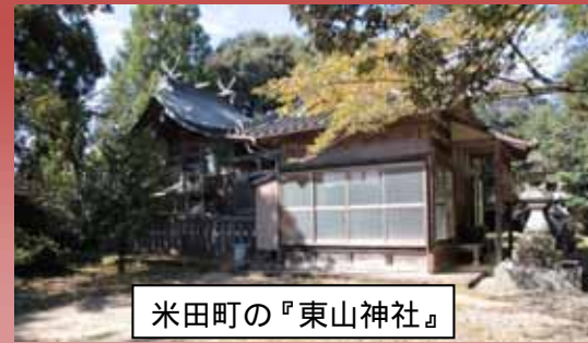
米田町の『東山神社』