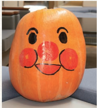
かぼちゃ(アンパンマン) 作-米原与志美 画-安藤文江