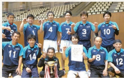
(写真) バレーボール競技で優勝を飾った社選抜