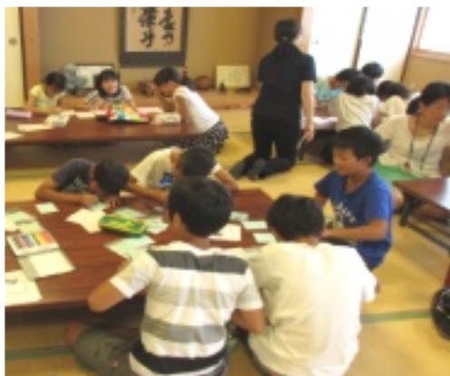
みんなで手紙書き

くなくなった。 ◎喜んでもらえるようにメッセージカードと折鶴を作りました。弁当と一緒に手渡したら喜んでくれてよかったと思いました。 ◎今まで知らなかったが、弁当をもらっておられるお年寄りの方が、同じ町内に住んでいる方で、この機会に知れてよかったです。今度道などで出会ったら、あいさつをしたいと思います。