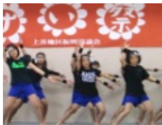
昨秋の「あげい祭」のコマ