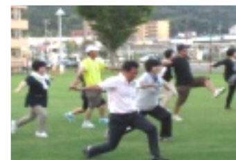
しっかりストレッチ

でストレッチ体操して、午後6時に公民館をスタートしました。 上井の街の夜景を見ながら、桜並木のトンネルの下を歩き、7時過ぎに大平山公園に到着。準備されたお茶とパンで休息。田後をめぐって8時40分頃には上井公民館に全員がゴールしました。 未だ、夏という中でナイトハイクだったため、参加者のゼッケンは汗でびしょびしょでした。 女性連絡会のメンバーに作って頂いた豚汁を、参加者はおかわりしながら疲れを癒しました。