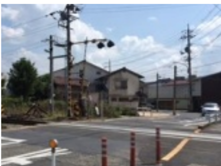
踏切を渡ると、そこは狭い道

倉吉駅の西、「神鋼機器」(株)付近に踏切がある。その踏切を北から南に渡る。列車が通過し遮断機が上がり、クルマを動かす。道は左にカーブしていて、クルマがすれ違うのがやっとなという狭さである。 道の左側に、電信柱が1本、そしてまた1本と急カーブ地点に連続して建っている。よく見ると、その電信柱にはいくつかもの擦り傷跡が…。 駅構内を徒歩通行が可能となり、179号線の跨線橋は4車線になって便利になった。とは言え、この踏切を通行する人や車は多い。