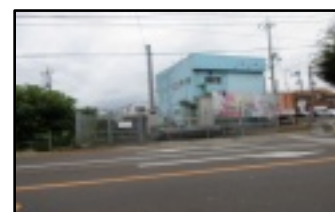
垣田病院近く、雨水ポンプ場

NO15(9月)「神鋼機器」の泰山木 NO16(10月)銭湯「旭湯」の看板に残る昭和のロマンの香り… NO17(11月)千枚岩の洞窟の“毘沙門天” NO18(12月)海田神社 【2009年】 NO19(1月)ふるさと上井はこんな町 NO20(2月)上井の町、海田村 NO21(3月)上井の町、福庭村 NO22(4月)上井の町、清谷村 NO23(5月)天神川は私達の「オアシス」 NO24(6月)初夏の天神川の河川敷を歩く。 NO25(7月)羽合用水に蛍が…。 NO26(8月)上井地区の4つの水門 NO27(9月)旧倉産高野球場裏「六増地蔵」 NO28(10月)上井の町、大平町