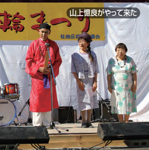
山上憶良がやって来た