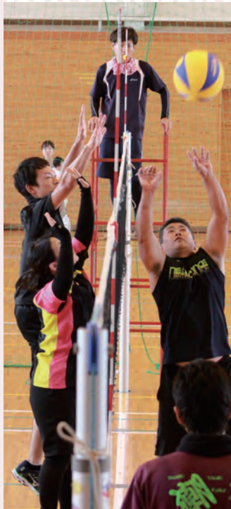
福光Aの正確なトス。このあとテタックが秋喜新町のブロックをかわして得点。

の6人制で、比較的参加しやすい競技ということもあり老・若・男・女と広い年齢層からの選手の参加があり、楽しい雰囲気の中、珍プレー、好プレーが応援席を大いに沸かせました。