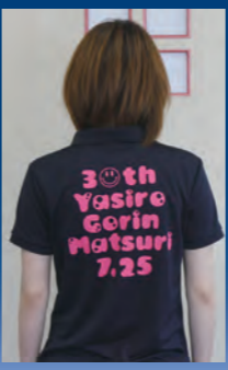
※五輪まつりポロシャツ着用で盛り上げる公民館スタッフ

イベントの企画内容もほぼまとまり、屋台の出店も15団体が届け出ている。社公民館では、市報の配布にあわせ、五輪まつりのプログラム、会場案内図、協賛企業様等を紹介するチラシを全戸配布する予定。