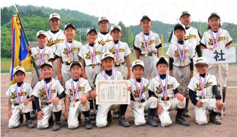
「日本海新聞 平成27年5月18日掲載」