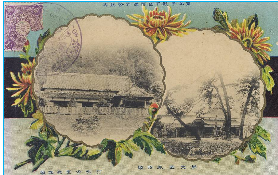
皇太子殿下山陰道行啓記念絵葉書(左が飛龍閣)

・・7月 contents・・★成徳ロマン 打吹公園内の飛龍閣 ★おしゃべり広場「びよびよ」参加者募集