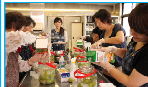
はじめての梅酒づくり教室 試食と試飲も大好評！ 飲めるようになるまで毎日ピンを眺めます。