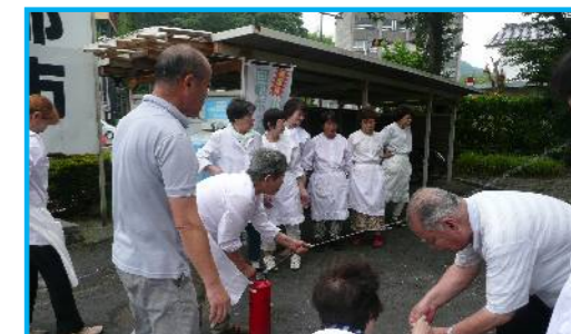
避難訓練 今年はふれあい給食2班のボランティアを対象に実施しました。

カルガモの親子 → 雛は孵化してから2か月で飛翔できるようになるらしいです。 ポケットパークにて 6月20日撮影