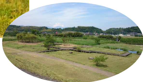
とってもきれいになりました！