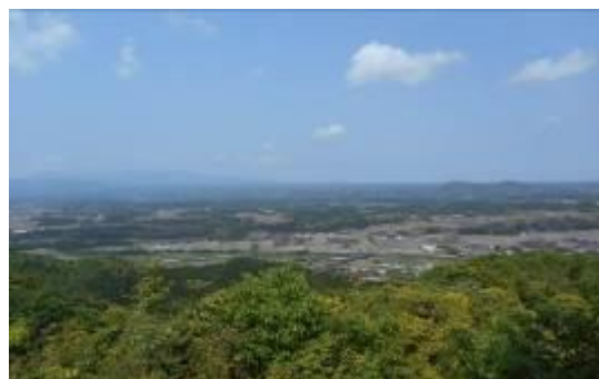
あたご山からの日本海

頂上からの景色はやはり素晴らしい！しっかり運動した後は、中村公民館（若土）に移動し、参加者みんなで賑やかに懇親会をしました。