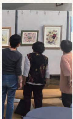
おしばなクラブの作品を鑑賞する来館の皆様

地区住民の皆様には、日頃より公民館事業にご協力頂き有難うございます。公民館のロビーに現在「おしばなクラブ」さんの作品を展示しております。ぜひ作品を見学にお越しください。今後も、作品を順次展示していきますので、ご覧ください。