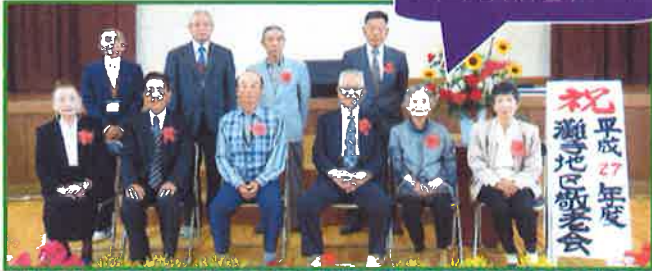
昨年度新会員さん