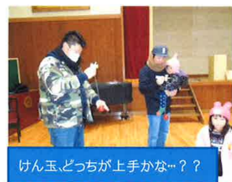
けん玉、どっちが上手かな...??