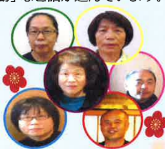
6人のメンバーです。