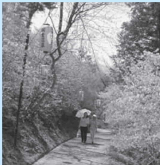
▲約6万本のツツジが自生する亀井公園