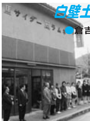
▲オープンした赤瓦十号館

12月3日、白壁土蔵群近くの琴桜観光駐車場前に「赤瓦十号館」として倉吉観光案内所、町屋カフェ和気、くらよし若者広場を開設しました。これは、若者(鳥取短期大学生)と地域と行政が連携して、中心市街地の新たな魅力・にぎわいを創出しようと、国が進める全国都市再生モデル事業の一環として整備したものです。