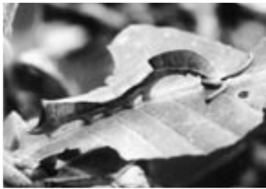
▲「スミナガシの幼虫」

一般210円、 大学・高校生 100円。 中学生以下・ 70歳以上・障害 をお持ちの人と 介助者一人は無 料。