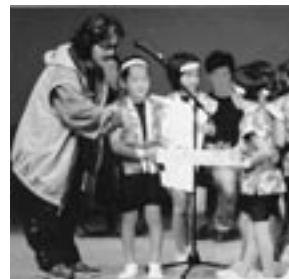
▲昨年のコンテストの様子

MALTA総合プロデュースによる第4回倉吉天女音楽祭を10月2日(日)、倉吉未来中心大ホールにて開催するにあたり、一部の「ジャンルを問わないコンテスト」の出場者を募集します。大ホールでの演奏を楽しんでみませんか。