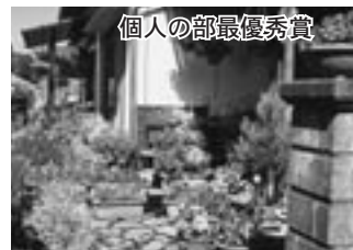
個人の部最優秀賞

倉吉まちづくり協議会で4月17日に審査を行ない、結果は次のとおりとなりました。おめでとうございます。(敬称略)