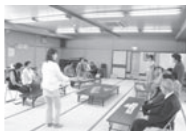
▲なごもろう会のようす 西郷地区

介護予防事業として閉じてこもりや認知症予防のため各地区で毎月「なごもろう会」を実施しています。この「なごもろう会」をたくさんの人に知って