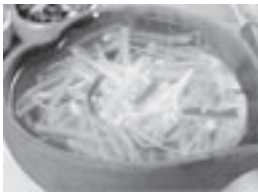
二日酔いによく効く「コンナムルグツ」(豆もやしのスープ)

今晩もお酒の誘惑に負けてしまったみなさん、明日の朝は韓国式で二日酔いを覚ましてみるのはいかがですか。