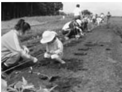
▲植付けを行う参加者

2日間で、予想を超える人の協力により、手際よく植付けが行えました。これから夏に向かい、国庁跡に元気よく向日葵が咲いてくれることでしょう。