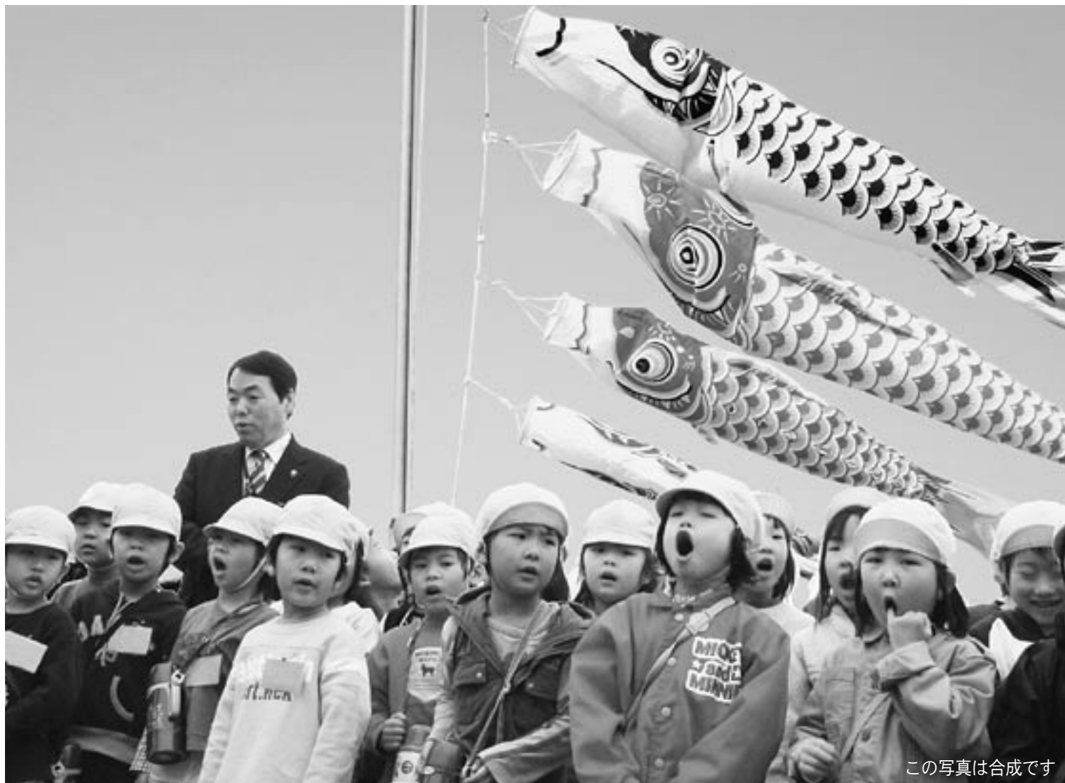
この写真は合成です