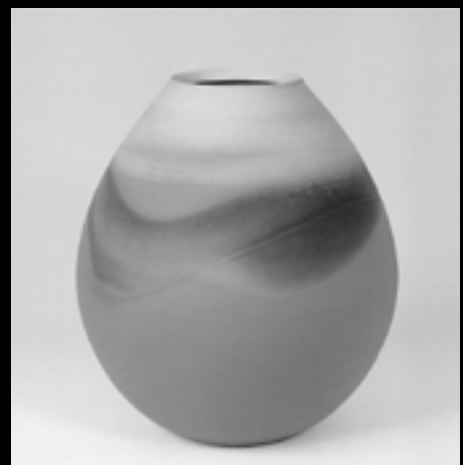
山本浩彩 《焼締窯変茜壺》 2005年