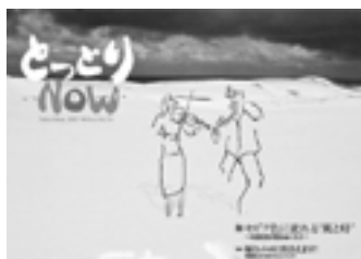
▲「とっとりNOW」(第76号)表紙

小学校や鳥取市国府町の「アトリエ小学校」(旧成器小学校)など、さまざまな木造校舎に「流れる時間」を追い、紹介しています。