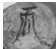
土器に書かれた則天文字「天」