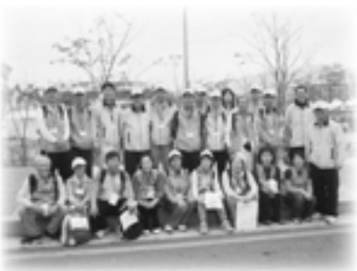
▶「国際ウォーキング大会」に参加された皆さんと(原州にて)