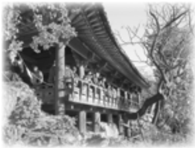
◀「竹西楼(チュクソル)」で三陟の景色を眺望する皆さん

しかし、楽しい経験であれ、辛い経験であれ、経験に勝る勉強法はないと思います。3泊4日という短時間で本何冊分かの勉強をされた皆さん、本当にお疲れ様でした。そして、この内容を見て韓国に興味を持たれた方は韓国語講座に参加してみませんか。