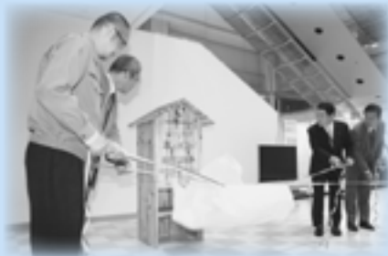
▲ 11月1日(木)に行われた贈呈・設置セレモニー