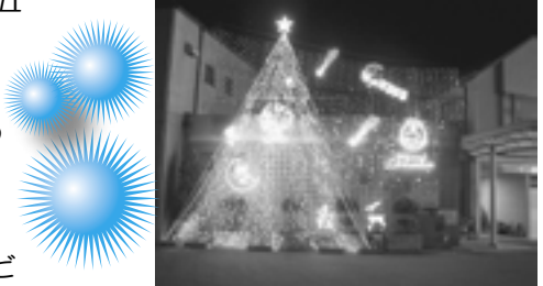
◀昨年度最優秀賞受賞作品

※問合せ先：ドリームイルミネーションコンテスト実行委員会事務局(〒682-0887 倉吉市明治町1032-6 こばやし薬局(向)本店内 / TEL 23-1231 / FAX 23-1235 / E-mail : drm-1@hotmail.co.jp)