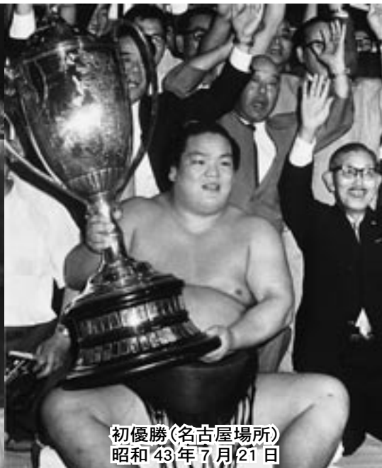
初優勝(名古屋場所) 昭和43年7月21日