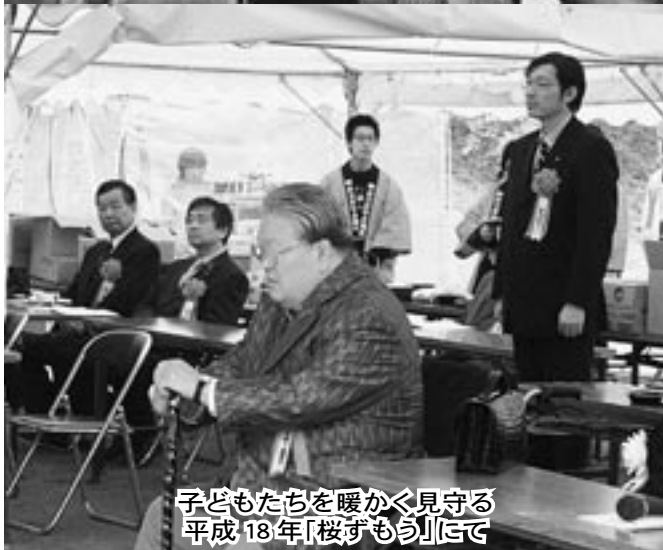
子どもたちを暖かく見守る 平成18年「桜ずもう」にて