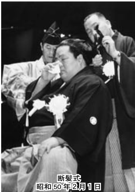
断髪式 昭和50年2月1日