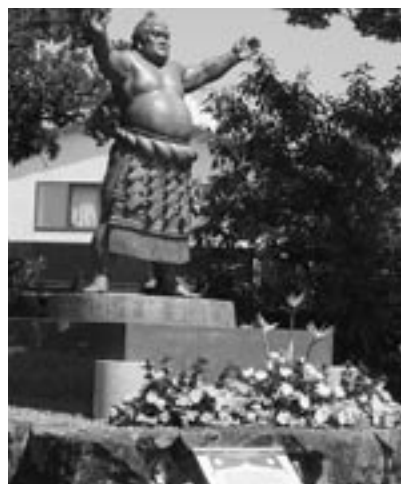
◀ 琴櫻の銅像前には たくさんのお花が供えられた