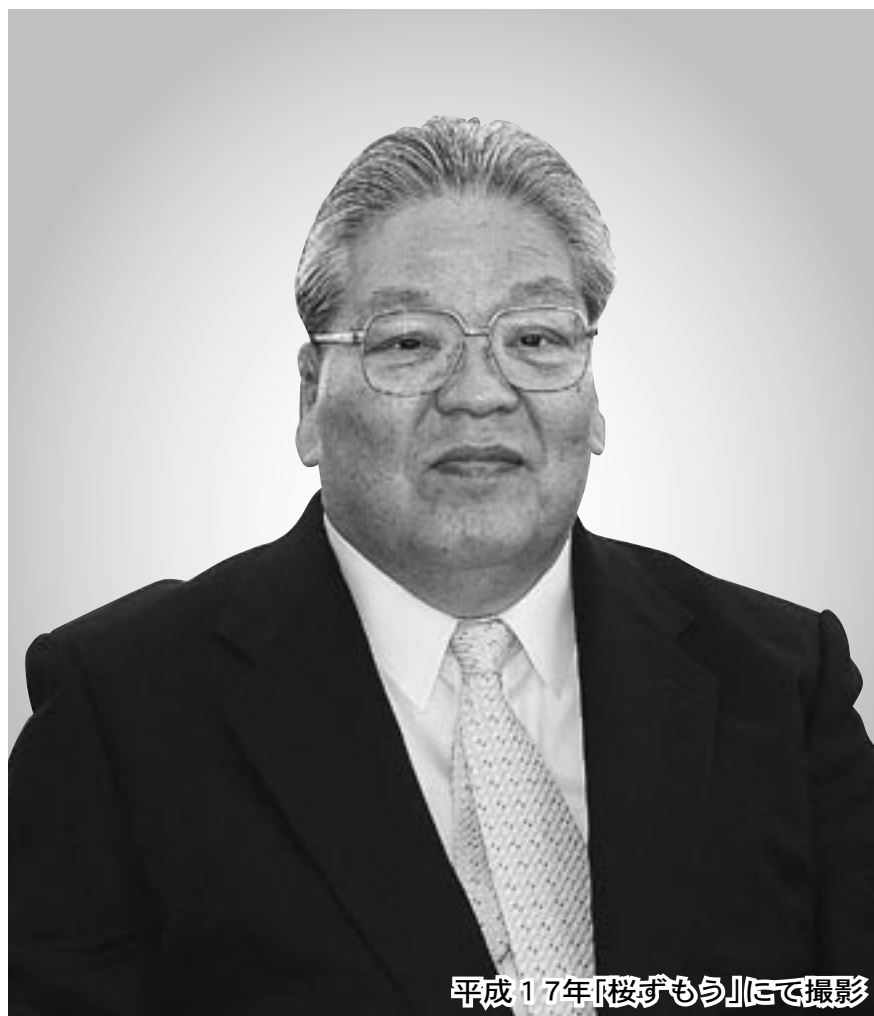
平成17年「桜ずもう」にて撮影