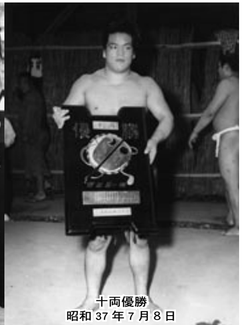
十両優勝 昭和37年7月8日