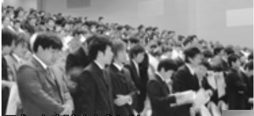
平成18年度「倉吉市成人式」

日時：平成20年1月13日(日)午後1時30分～3時30分 会場：倉吉未来中心大ホール 対象：昭和62年4月2日から昭和63年4月1日までに生まれた人で、市在住または住んだことのある人 案内：市在住の人へは、11月中旬から、本人宛案内通知を発送します。 現在、市在住でない人については、電話受付をしますので、生涯学習課へ申し込んでください。 詳しくは、11月1日号の市報で、お知らせします。 ※連絡先・問合せ先：生涯学習課(☎22-8167)