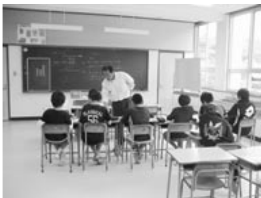
▲きめ細かい授業展開(少人数指導)

子どもたちは、日々、大人の話会話を聞いたり、行為を見たりしています。そして、大人を手本とし自分の生き方を見つけ成長していきます。未来を生きる子どもたちに指導する前に、今一度、大人一人ひとりが自分の生き方(生活)を振り返ってみませんか？