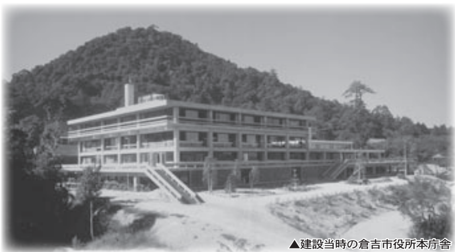
▲建設当時の倉吉市役所本庁舎