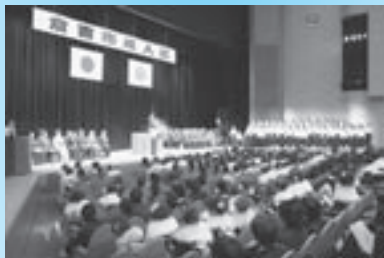
▲平成18年度倉吉市成人式

成人式大賞各賞受賞は、全国から応募のあった114件のうち各賞51件が受賞しました。