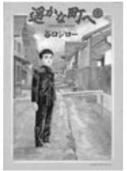
◎谷口ジロー「通かな町へ」小学館