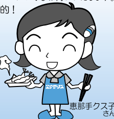
恵那手クズ子さん

株式会社 エナテックス [信頼と技術と笑顔の会社] 倉吉市海田西町2丁目37 Tel:28-1111 E-mail:enatex@enatex.co.jp HP: http://www.enatex.co.jp/