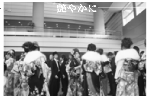
◀市内の「ダンス&ミュージック倉吉」のメンバーもダンスでお祝い