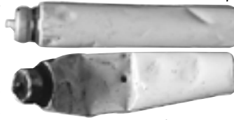
▲出火原因のスプレー缶

9月27日(土)の不燃物の収集作業中に車両から出火がありました。「不燃物の日」のコンテナにヘアカラー、スプレー缶が混入したことが原因でした。大事には至りませんでした。場によっては、作業員の生命に関わる可能性もあり、非常に危険です。スプレー缶やカセット式ガスボンベを出すときには、中身を使い切つて、はつきりと大きな穴をあけて、缶類の日に出してください。