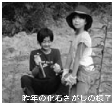
昨年の化石さがしの様子