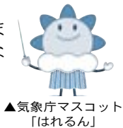
▲気象庁マスコット「はれるん」