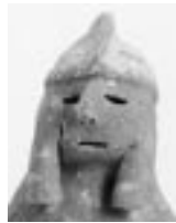
▲沢べり七号墳出土

博物館の展示品の中から古代に暮らした人々の表情を紹介します。写真右は、不入岡の沢べり七号墳から出土した男性像の人物埴輪です。