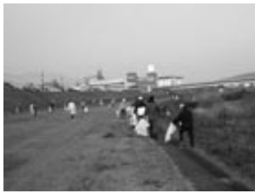
▲昨年の天神川一斉清掃の様子