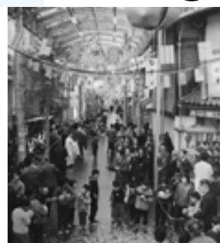
西町アーケード(昭和37年)