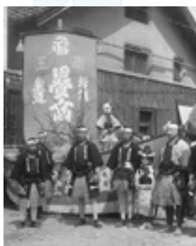
広告祭(昭和10年ごろ)