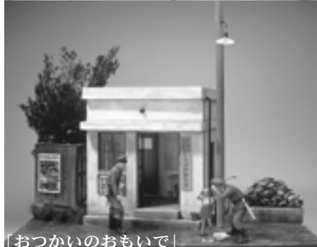
「おつかいのおもいで」