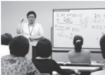
▲韓国語市民講座の様子

私は、日本と韓国がお互いに理解を深めていくことによつて、次第に仲良くなれたらと願いつつ、皆さんと韓国のパイプ役としてお手伝いができることをうれしく思っています。