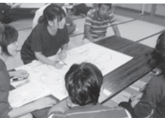
▲今年の小田人権同和教育町内学習会

「町内学習会の参加者が固定化している」、「町内学習会はこれでいいのか?」といった声を聞きます。 そこで、地域全体で作り上げ、参加できる取り組みを実践している上北条地区の小田の町内学習会を紹介します。